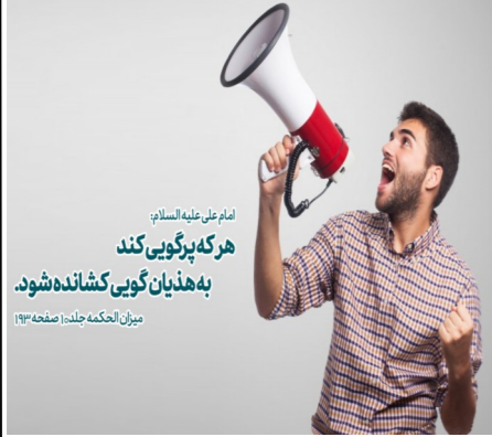
امام علی علیه السلام هر که پرگویی کند به هذیان گویی کشانده شود. میزان الحکمه جلد: صفحه ۱۳۴